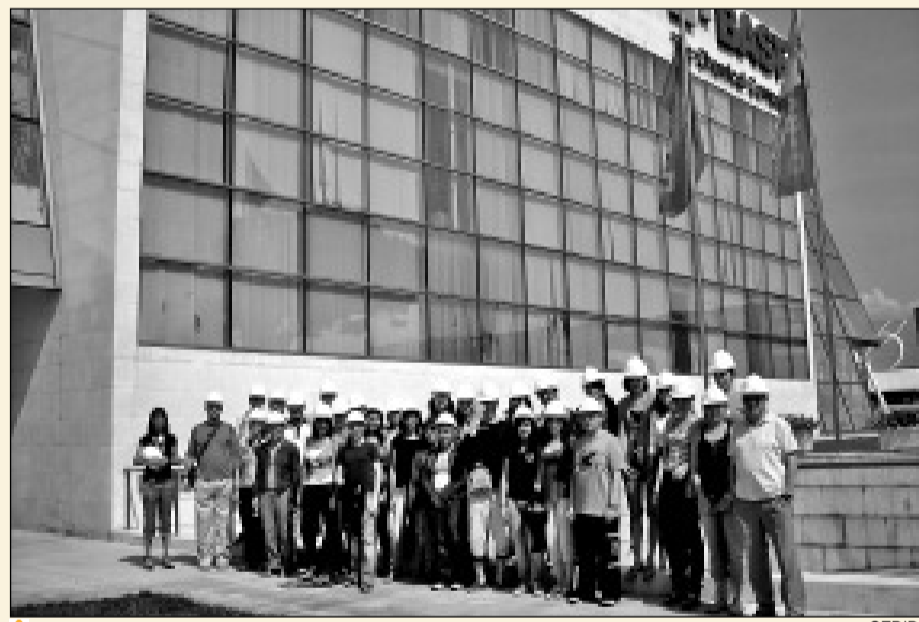
Els participants del curs, davant la seu de l'empresa BASF a Tarragona.

L'any passat BASF va patrocinar els juliols de la UB i aquest any ha volgut continuar amb aquesta interessant experiència. Precisament, entre els 53 cursos que integren els juliols de la UB hi ha el curs Bona quími-